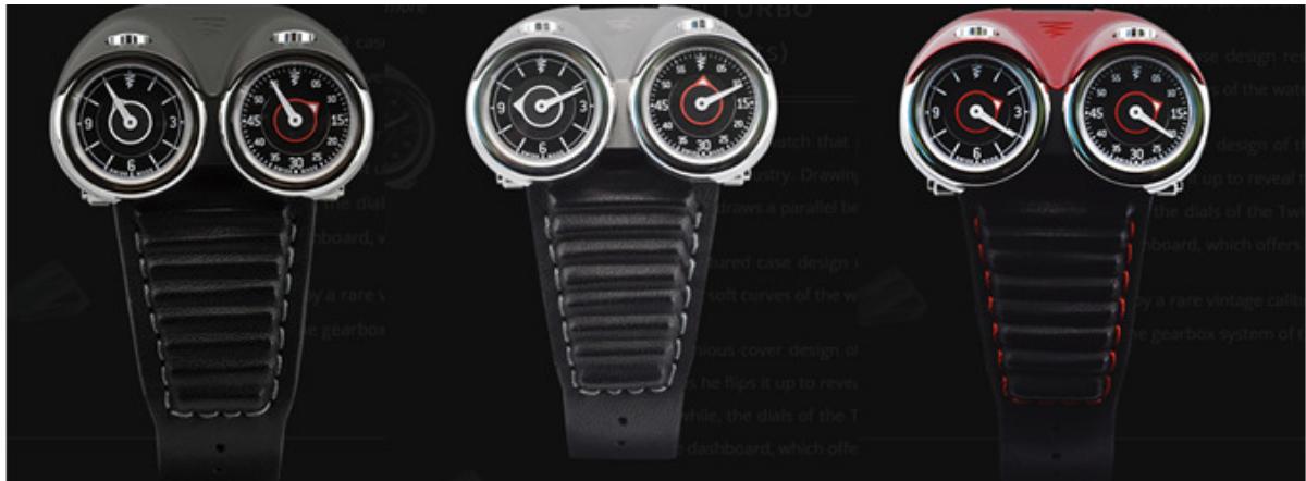
アンスラサイト Ref. TWIN TURBO-AN