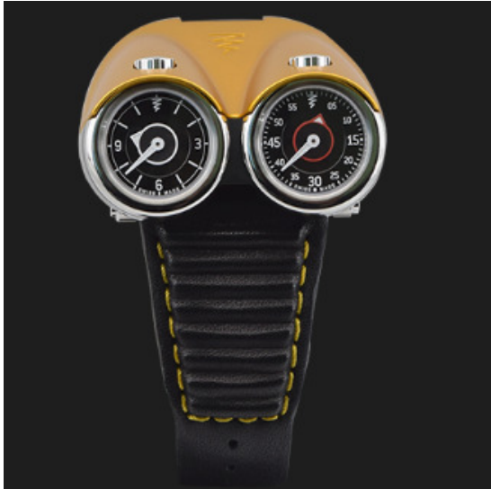
イエロー Ref. TWIN TURBO-YL