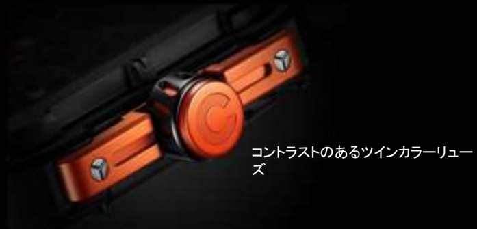
コントラストのあるツインカラーリューズ