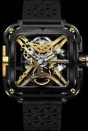
ゴールデン X021-BLGO-W25BK ¥99,000 チタン合金