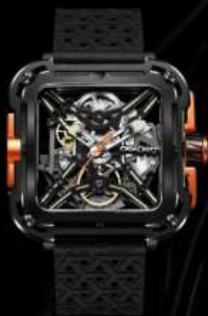
ブライトオレンジ X011-BLOG-W25BK ¥74,800 SS