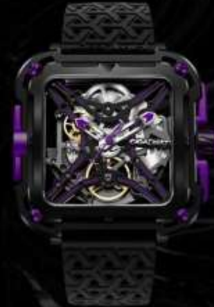
ネオンパープル X011-BLPL-W25BK ¥74,800 SS