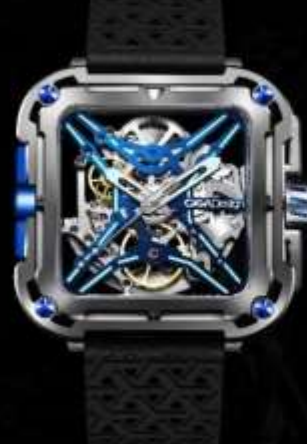
サイバーブルー X021-TIBU-W25BK ¥88,000 チタン合金