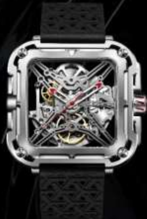
スペースシルバー X011-SISI-W25BK ¥74,800 SS