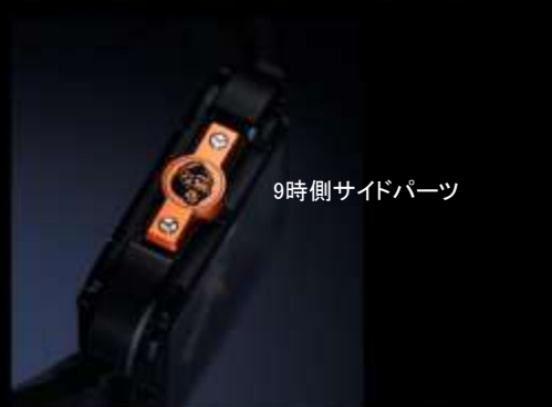
9時側サイドパーツ