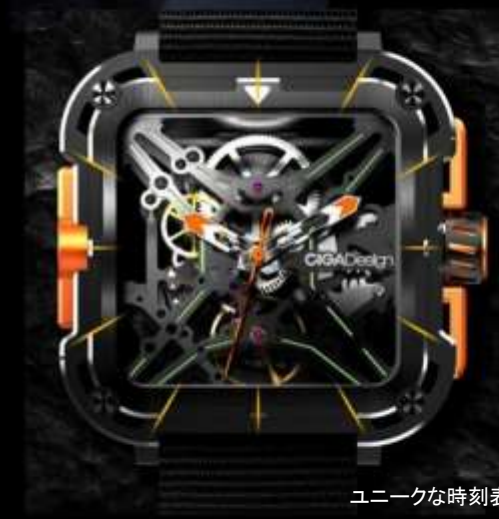
ユニークな時刻表示