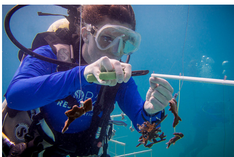
珊瑚復元財団は積極的に繁殖と新しい珊瑚を既存の礁に再移植しています

オリスの新しいパートナーは珊瑚復元財団は世界の珊瑚礁の保全の為に活動している非営利の海洋保全団体です