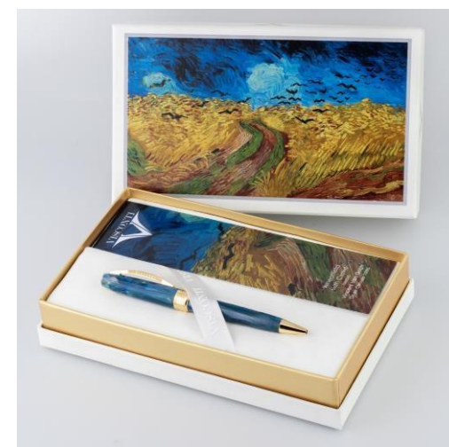
ボールペンのセット