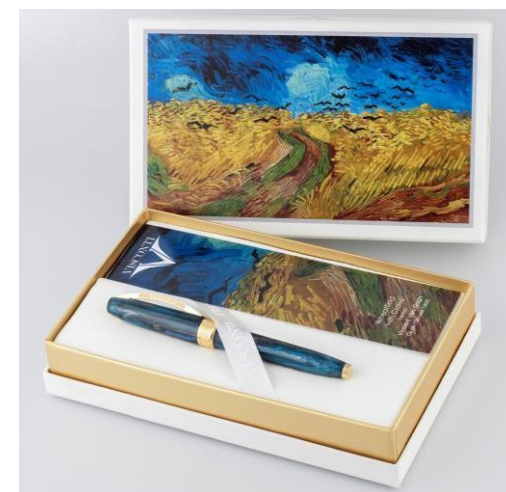
ローラーボールのセット